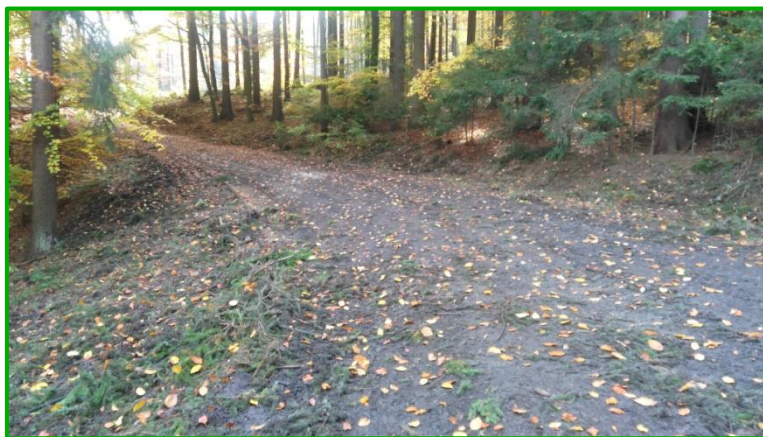
Pohled na vozovku v km 0,630